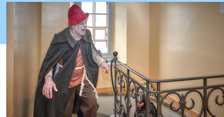
Mathes Ganz gespielt von Christoph Schwager